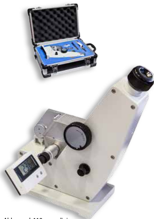
Abbe mod. 110 con valigia di trasporto